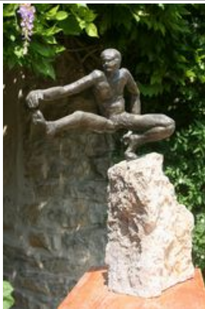
P 30 x H 60 x L 60