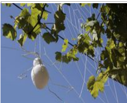
Installation au fil croché : env. 6 m x 6m