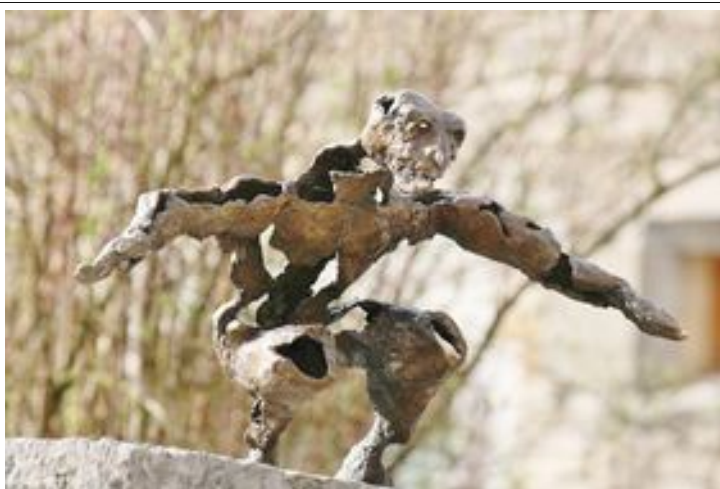
L 55 x h 35 x P 30