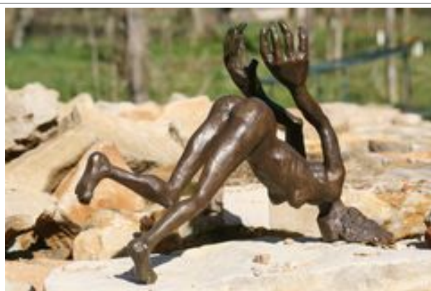
L35 x h 25 x l 15