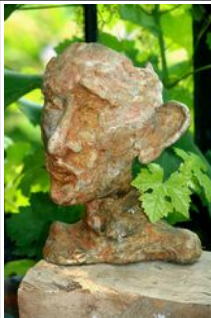
P 20 x H 30 x L 20