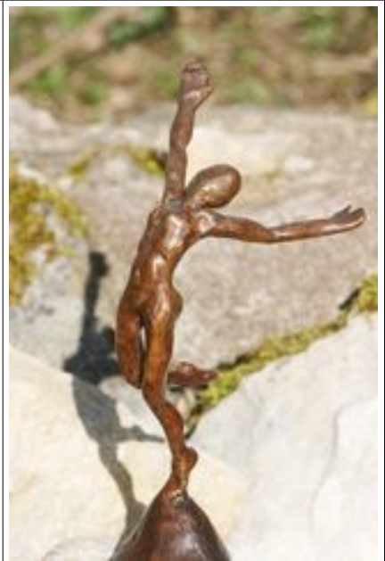
P 20 x H 35 x L 15