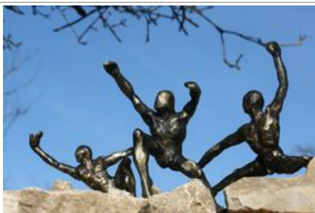
L 80 x H 30 x P 20