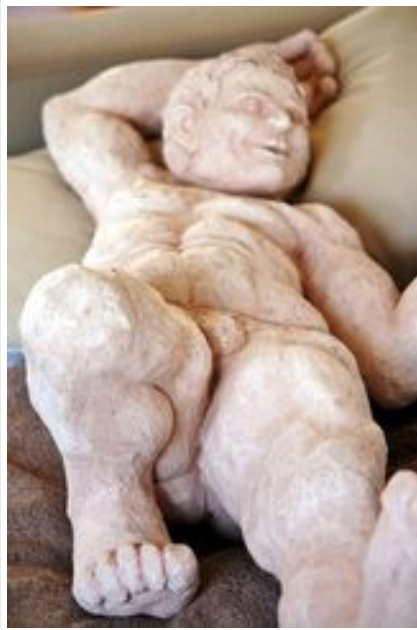
H 80 x P 25 x L 40